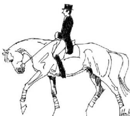
Diagramme ii Bas et rond